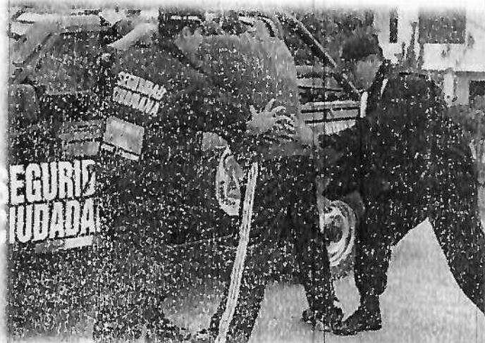
FIGURA N° 1: INTEGRANTES DE SEGURIDAD CIUDADANA

La oficina de seguridad ciudadana es la encargada de consolidar la estadística delictiva de registros y formular los mapas del delito estadísticas integradas que unifica la información de la ocurrencia registradas por el cuerpo de Serenazgo obtienen unificación de fuerzas y canalización óptima de los recursos municipales.